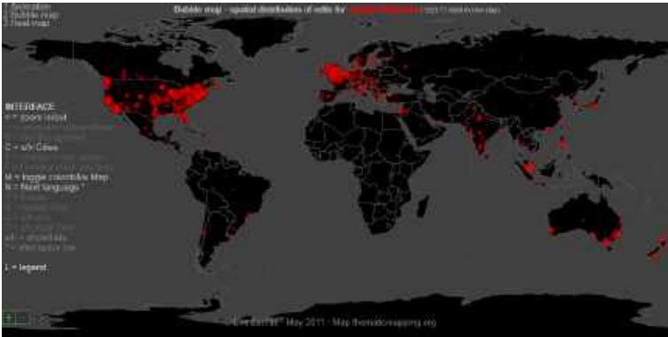
Mapa 1. Mapa de burbujas. Distribución espacial de las ediciones en la Wikipedia en inglés

Un primer mapa muestra que el contenido de la enciclopedia es escrito principalmente por occidentales.